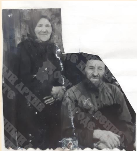
Мои мама и папа в старости